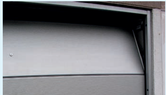
1 Modèle «classic» en panneaux sandwich, teinte RAL hors standard 2 Emetteur stylo 4 canaux

Pour aérer votre garage, vous avez la possibilité de basculer vers l'intérieur la section supérieure de la porte lorsque celle-ci est fermée.